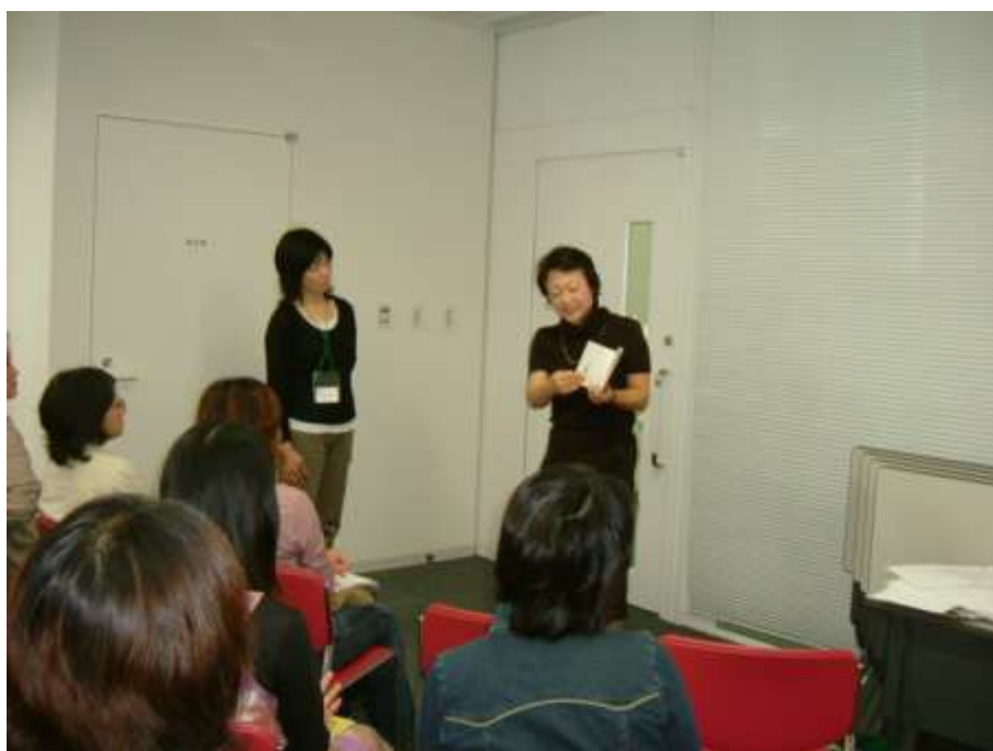
第3回講座 読み聞かせの指導

このたび講座および交流会の様子をまとめ記録集を作成しましたので、皆様の活動にお役立ていただければ幸いです。あおば学校支援ネットワークでは、今後も地域やボランティアのニーズに応えながら皆様の活動のお手伝いをしてまいります。